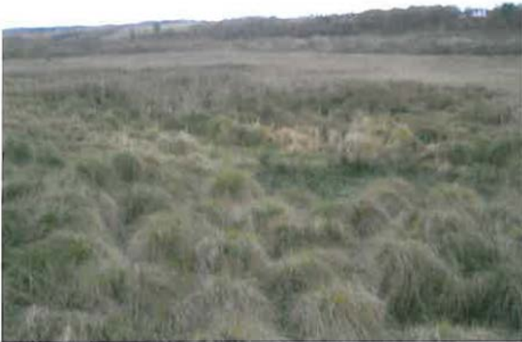
mark 1-2i i forgrunden og mark 1-2k i baggrunden