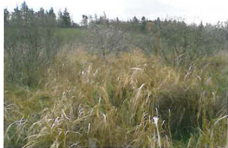
mark 1-2k, fradrag af område med <50% græsmarksplanter/75-95% vådbundsplanter/siv